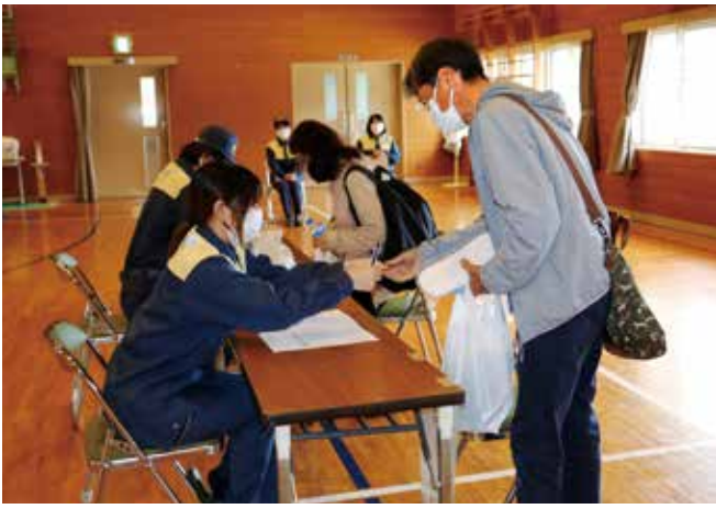
伊方・瀬戸・三崎の町内3ヵ所に一時集結所を開設し、一般住民の避難受付を行った。写真は伊方中学校体育館に開設した一時集結所の様子。住民はこのあと、県の手配したバスで松前公園へ避難しました。