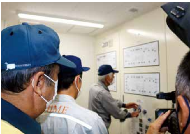
佐田岬防災センターで、周辺地区住民が放射線防護設備を稼働させる訓練を行いました。

※1 原災法：「原子力災害対策特別措置法」。原子力災害に対する対策の強化を図るための法律。 ※2 第10条：発電所付近で基準値以上の放射線量が検出された、またはその他の政令で定める事象が発生した場合、事業者は内閣総理大臣や自治体などに通報するよう義務付けられている。 ※3 第15条：内閣総理大臣は原子力緊急事態が発生した場合、原子力原子力緊急事態発言を発し、必要な対策を講じなければならない。