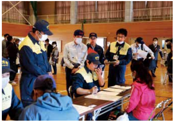
伊方地域一時集結所の外国人避難者受付所。令和4年度から町内の外国人を対象とした避難訓練を実施をしている。翻訳アプリや愛媛県国際交流センターを通じた3者間通話により、日本語が不慣れな方との円滑なコミュニケーションを図る訓練を行った。