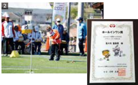
1 愛媛県南予代表の6名の選手 2 ホールインワン賞

グラウンドゴルフを始められて4年になる塩成にお住いの佐々木さん。足のケガもあり、スポーツができませんでした。ご主人からの勧めもあって今では夫婦で楽しんでおられるそうです。