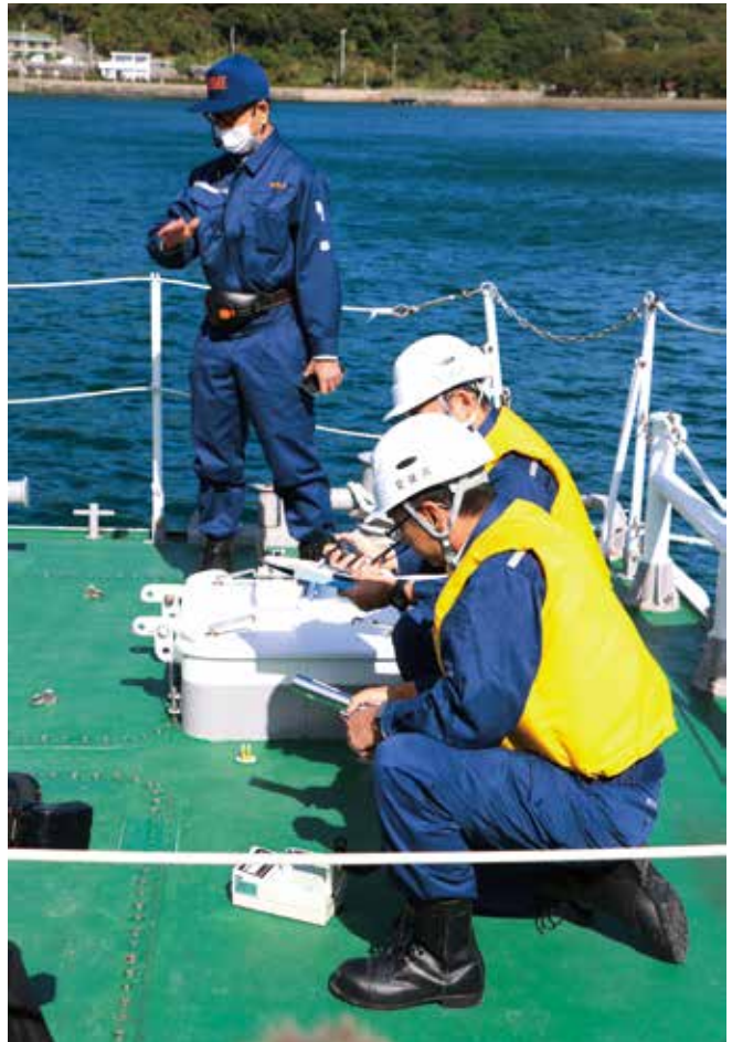
海路避難時の安全確認のため、海上モニタリングを実施。県職員が三机港に着岸した松山海上保安部の巡視艇の船上で、空間放射線量率の測定などの手順を確認しました。