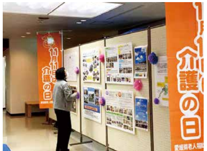
町内の6つの福祉施設ご協力のもと、施設紹介パネルを展示。