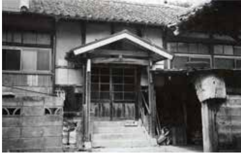
『社会教育だより』66号より

長い間様々な人に守られて今日まで残ってきた建物ですが、そんな村役場も今年で取り壊しとなりました。1世紀以上にわたり、三崎を見つめてきた建物の最期、しっかりと見届けたいものです。