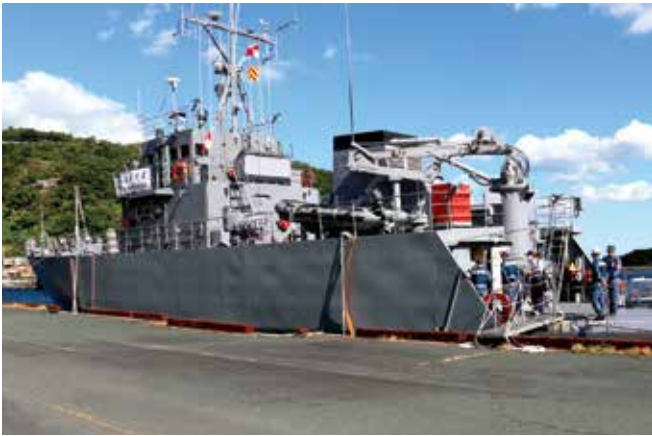
海上モニタリングを実施した松山海上保安部の巡視艇。