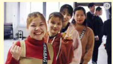
【写真 ①～③ 式典で自己紹介と抱負を発表、④ 式典終了後に、⑤～⑦ 楽しく賑わった茶話会】