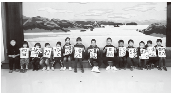
伊方会場(1月7日 町見公民館)の様子