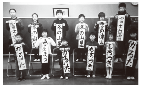
瀬戸会場(1月7日 三机小)の様子