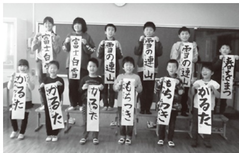
瀬戸会場(1月7日 大久小)の様子