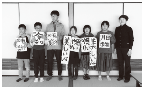
伊方会場(1月6日 中央公民館)の様子