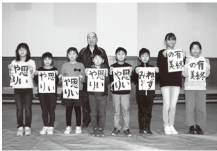
三崎会場(1月7日 三崎支所)の様子

りますのでぜひご覧ください。 また、食生活改善推進協議会のご協力で、七草粥が振る舞われました。