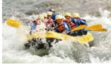
一番人気のラフティング