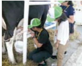
アイスクリーム作り、酪農体験

はいや伊方まつり」で本町を訪れた児童たちと班ごとに分かれ、各教室を見学し、アイススケートやドッチボールを行いみんなで楽しく交流しました。この研修事業では、交流事業のほかラフティング体験、アイスクリーム作りや酪農体験、札幌時計台の見学等を行い北海道を満喫しました。