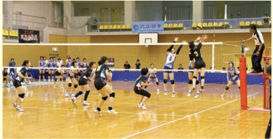
手に汗握る熱戦「岡山シーガルス」と愛媛のクラブチーム「CLUB EHIME」の練習試合 地元中学生も途中参加し、ナイスアタック!