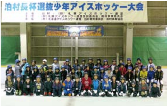
泊村児童とアイススケートで交流

この事業は、文化・人の交流、体験学習等を通して将来幅広い考え方や行動力のある人作りを行うことを目的として、北海道泊村と姉妹町村縁組を締結した翌年の平成11年から継続して実施している事業です。これまで400名以上の児童がこの事業で北海道を訪れています。