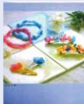
※写真は、イメージです。

9月19日(土)、午後2時から、工作教室を行うよ! ペットボトルを切って好きに色をつけてオーブントースターで焼くだけ・・・。 友だちさそって児遊館に遊びに来てね! 参加費は無料です。