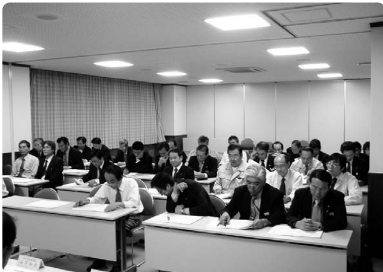
専門部会合同会議

合併までには、まだまだ多くの事務作業がありますが、合併して良かったと思えるまぢづくりのため、新町事務に支障をきたすことのないよう細部にわたつての確認をしながら進められていきます。