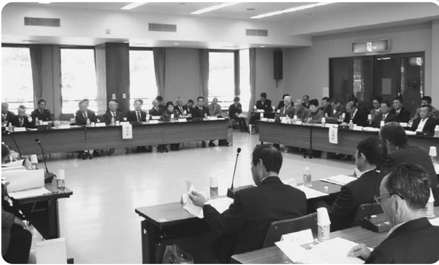
第14回合併協議会開催

平成16年3月5日(金)午後2時から三崎町民会館において、第14回合併協議会が開催されました。