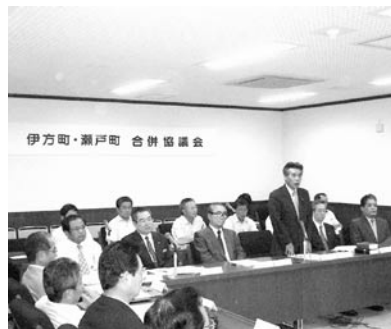
第1回 合併協議会の様子